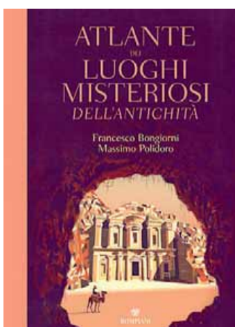
• Atlante dei luoghi misteriosi...