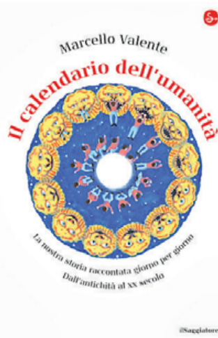
• Il calendario dell'umanità

Che giorno è oggi? È il 16 novembre del 1532 e a Cajamarca, nel cuore dell'impero Inca, i conquistadores spagnoli di Pizarro con l'inganno catturano il sovrano Atahualpa. Pochi mesi dopo lo metteranno a morte. Ecco, questo originale godibilissimo calendario racconta la nostra storia giorno per giorno, dall'antichità al XX secolo. Dal 1 gennaio 1959,