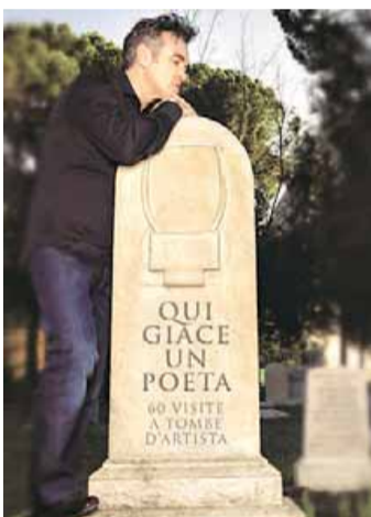
• Qui giace un poeta

I nostri suggerimenti. Stavolta non proponiamo le opere dei "soliti" autori noti e da classifica ma alcuni testi, curiosi e molto spesso anche imprevedibili, che si concretizzano in letture particolarmente stuzzicanti