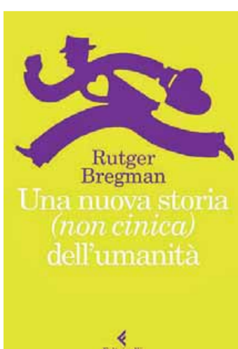
• Una nuova storia (non cinica)...