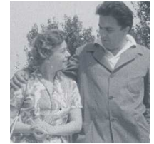
INEDITO Masina e Fellini

Rai, ecco la tv prima della tv: un conto alla rovescia