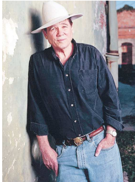
COL CAPPELLO BIANCO James Lee Burke

VENTIDUESIMO (DI 23) VOLUMI DELLA SAGA PORTATA AL CINEMA CON I VOLTI DI ALEC BALDWIN E TOMMY LEE JONES